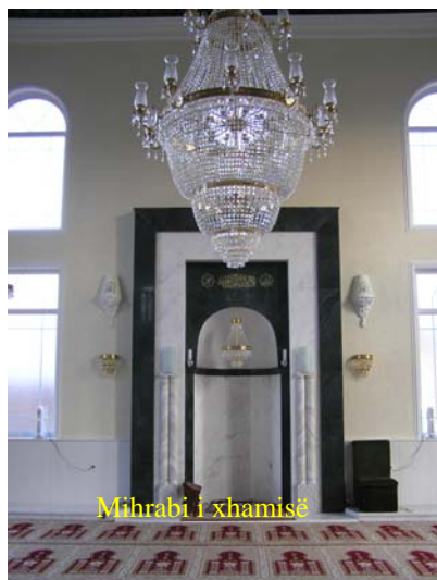
Mihrabi i xhamisë