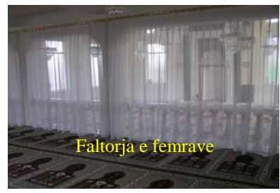
Faltorja e femrave